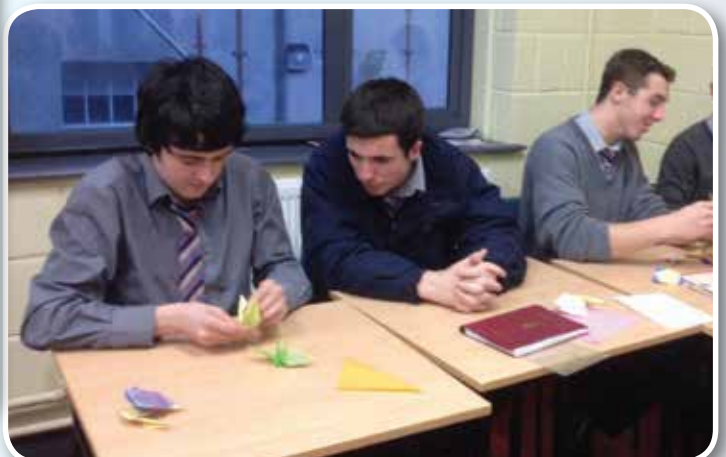
Muintir na hIdirbhliana i mbun origami.