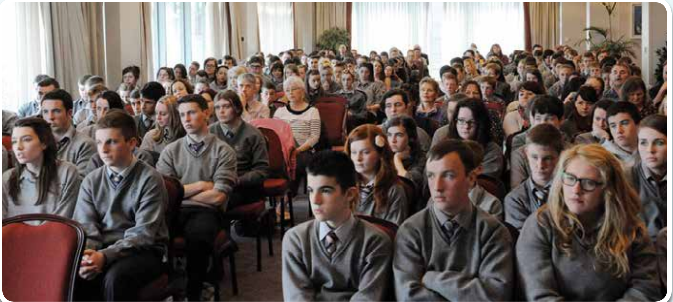
An slua ag éisteacht le gach aon fhocal!

Comghairdeachas leis na daltaí uile, a gcuid tuistí agus múinteoirí as an éacht atá déanta acu.