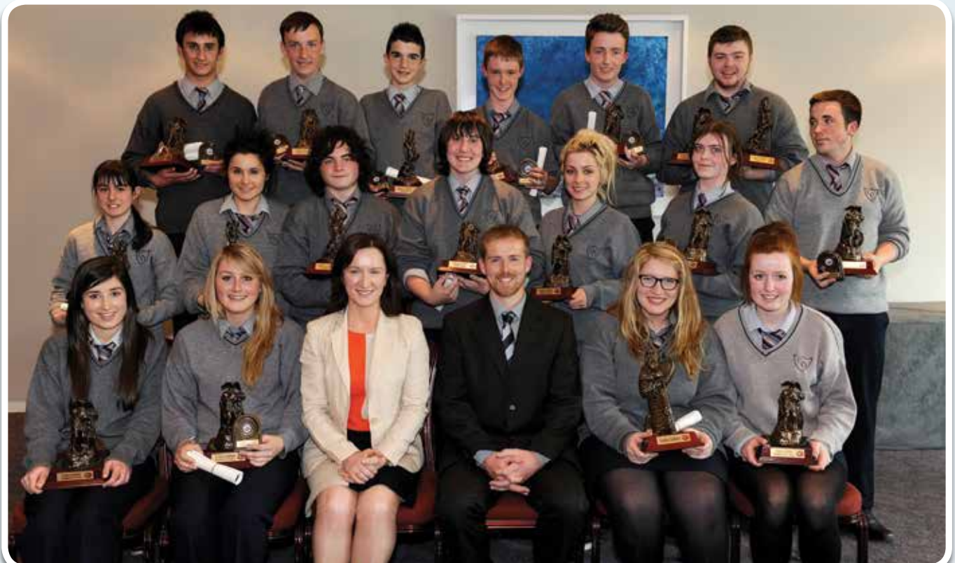
Na buaiteoirí ar fad ar Lá Bronnta 2012/13 in éineacht leis an Leas Phríomhoide agus an Príomhoide.