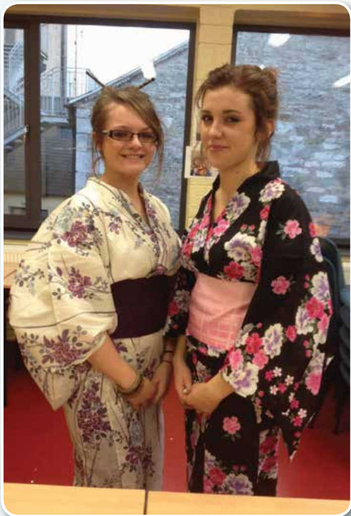
Daltaí na hArdteiste agus éadaí traidisiúnta ón tSeapáin á chaitheamh acu.